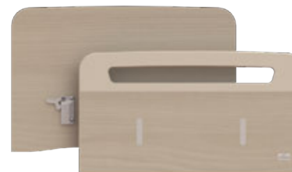
Dossierets Oréline | OP-LPAN01-OR

Dossierets monoblocs MDF 22 mm décor stratifié Main courante laquée