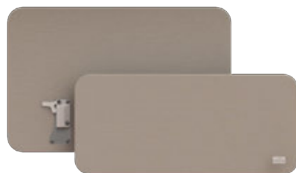
Dossierets Capri | OP-LPAN30-CR