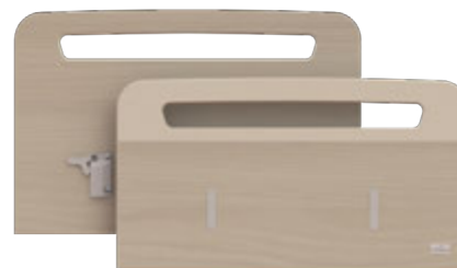
Main courante en tête | OP-LPAN01-MC

Dossierets bois aggloméré 19 mm décor mélaminé Main courante hêtre massif laqué ou vernis