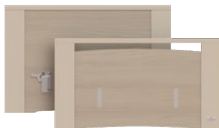
Dossierets Artémis | OP-LPAN12-VC

Dossierets monoblocs MDF 22 mm décor stratifié Main courante laquée